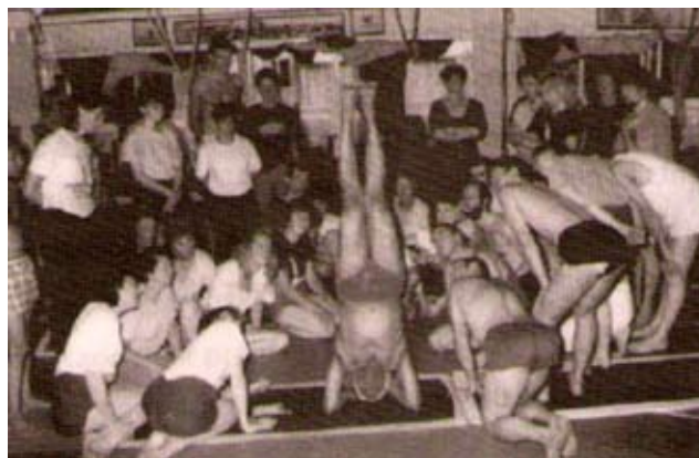
Визуальный образ важнее вербальных инструкций

• Показывайте и повторяйте инструкции для одного действия несколько раз в каждую сторону.