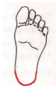
Прижимайте полукруглую часть пяток.